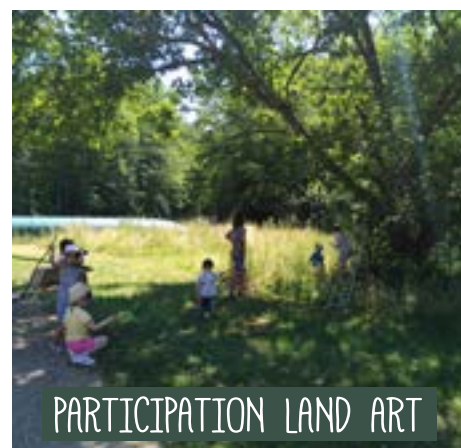
PARTICIPATION LAND ART