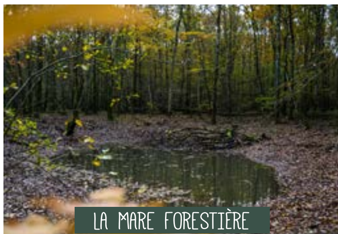
LA MARE FORESTIÈRE

Un panneau pédagogique viendra compléter cet aménagement. Un entretien régulier devra être opéré par la suite (tous les 2 à 3 ans environ).