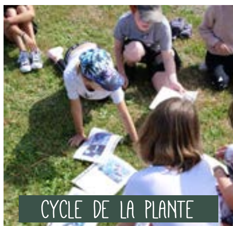
CYCLE DE LA PLANTE